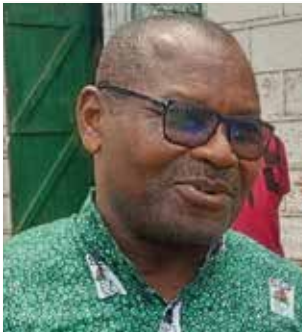
by Moïse Raymond NGUIDJOL NGAN